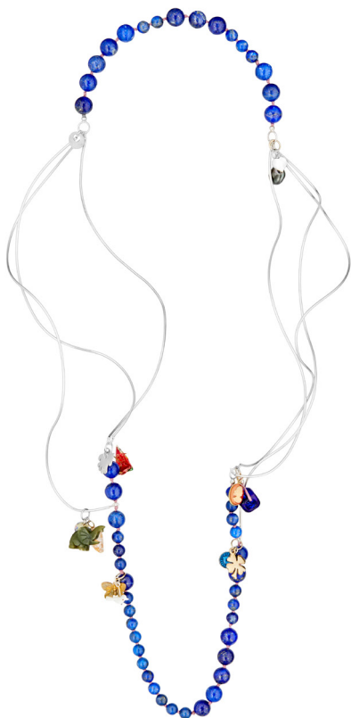
Souvenirs Den Sorte Plads 2023

Sølv 925, 14 kt guld, lapis lazuli, silkestråd, tigertail, jade, sneglehus, glas, papir, messing, plastic, Tahiti keshi perle, perlemor