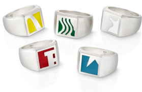
Voices Rådhuspladsen 2023