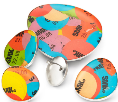
Tickets SMK 2023

Sølv 925, brugte billetklistermærker, resin, rustfri stål