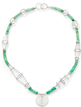
Små Konstruktioner På Line 2023

Cirklen er et stærkt geometrisk element og evighedssymbol i arkitekturen og i smykkekunsten, og et element i mit formsprog, som det ses på de smykker jeg har valgt at vise i udstillingen med temaet "Cityringe".